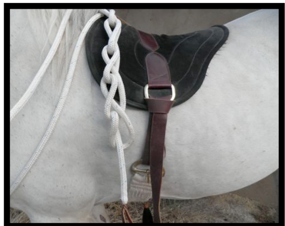
Fig.6 Aspecto final