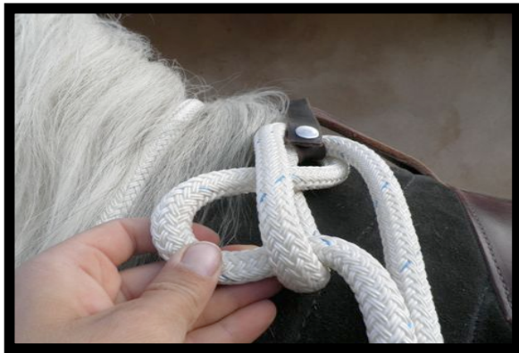
Fig.3 Introducir un bucle dentro del anterior con el sobrante del ramal