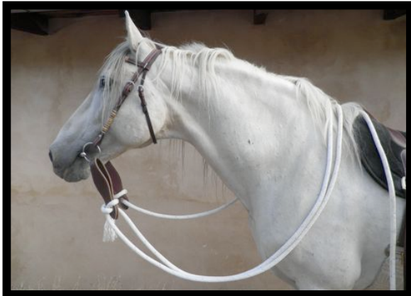
Fig1. Disponer el ramal a la misma longitud de las riendas.