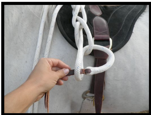
Fig.5 Introducir el popper en el bucle