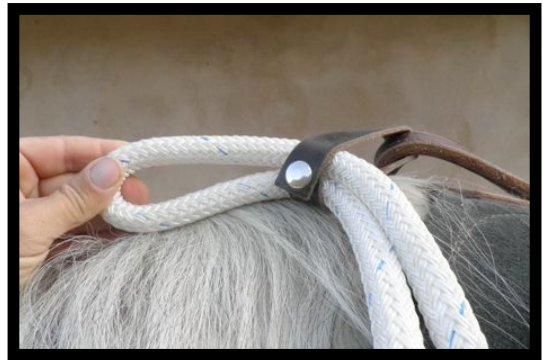
Fig.2 Introducir el ramal formando un bucle a través de la correa de cuero.