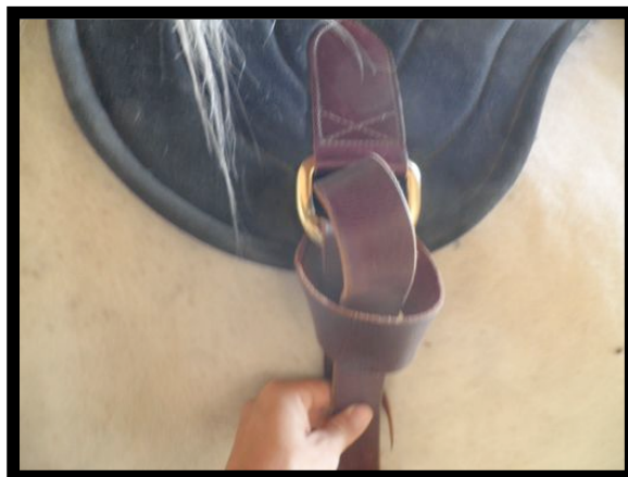
Fig.4 Introducir el látigo por el bucle, Fig.4