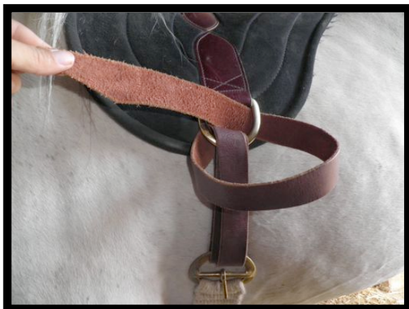
Fig.3 Pasar el látigo por delante para introducirlo por la anilla como se muestra en la Fig.3