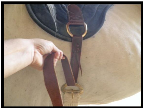
Fig.1 Ajustar el látigo de la montura o del bareback pad como se muestra en la Fig.1